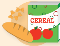
Cereales y pan