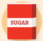
Azúcares de un solo ingrediente usados para cocinar y hornear