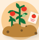
Plantas y frutos secos o semillas